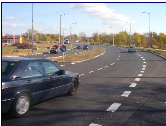
Zmodernizowana Al. M. J. Piłsudskiego