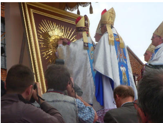
Koronacja Obrazu Matki Bożej Miłosierdzia

gotowano na umieszczenie ponad 650 metrów bieżących dokumentacji