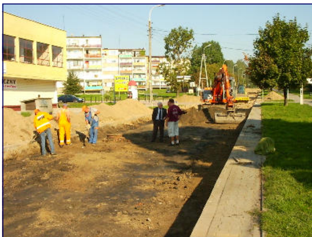
Budowa i remonty dróg to priorytet w działalności II kadencji powiatu skarżyskiego

i niebezpiecznego ruchu na skarżyskim odcinku krajowej siódemki. Ostatnie lata to także dobry okres pod względem pozyskiwania środków unijnych . W sumie powiat skarżyski i jego jednostki na różne cele otrzymał ok. 18.265.481 zł, z czego prawie 8 mln. zł na inwestycje drogowe, 3.433.874 zł dla szkół, 6.831.607 zł i 53.000 EUR na poprawę i aktywizację powiatowego rynku pracy. Na odnotowanie zasługuje również fakt skutecznego pozyskiwania i wykorzystywania środków finansowych na aktywację osób pozostających bez pracy, oraz łagodzących skutki bezrobocia. W minionej kadencji kwota pozyskana za realizację programów związanych z rozwiązywaniem problemów lokalnego rynku pracy wyniosła 7.308.740 zł. Obok inwestycji samorząd powiatowy pamiętał także o najbardziej potrzebujących mieszkańcach powiatu. Z myślą o nich, co roku przeznaczono na cele związane z pomocą społeczną i na potrzeby niepełnosprawnych mieszkańców kwotę 14.026.451,00 zł. Ponadto utworzyliśmy pierwszą w