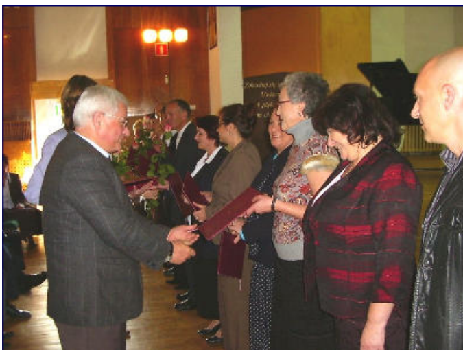
Starosta Łukasz Wojciechowski wręcza nagrody Starosty.