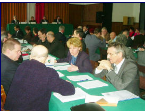
Radni w 2005 r. odbyli 10 posiedzeń.

Ubiegły rok upłynął Radnym Powiatu Skarżyskiego i Zarządowi bardzo pracow-