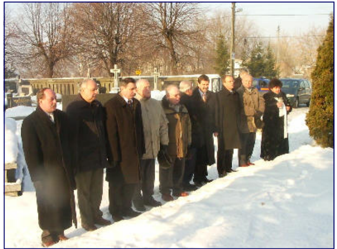
Delegacje oddają hołd poległym żołnierzom, których mogiły znajdują się na skarżyskim cmentarzu.