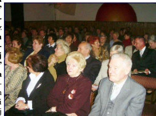
Uczestnicy Koncertu