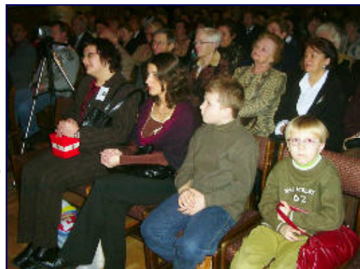
Uczestnicy Koncertu