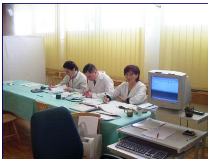
Komisja Lekarska podczas pracy przy poborze. Sala Herbowa Starostwa Powiatowego.