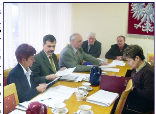
Zarząd Powiatu w 2005 r. wypracował 63 uchwały.

realizując zadania ustawowe oraz dokonując analizy sytuacji Powiatu Skarżyskiego, m.in. pod kątem funkcjonowania służby zdrowia, oświaty, przeciwdziałania bezrobociu oraz aktywizacji lokalnego rynku pracy, zarządzania drogami powiatowymi, bezpieczeństwa publicznego i przeciwpożarowego oraz realizacji uchwał przyjętych przez Radę Po-