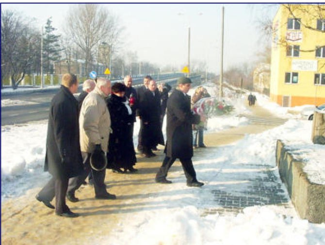
Delegacje składają hołd pod tablicą pamiątkową przy ul. Legionów