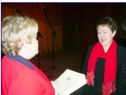
M. Grzmił odbiera z rąk Prezes Fundacji W. Kuźni brylantowy certyfikat.

Był to już 17 koncert charytatywny działającej na terenie powiatu od 5 lat fundacji