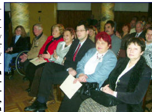
Uczestnicy Koncertu